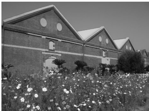
大里製粉所時代からの倉庫。現在はニッカウヰスキー門司工場(旧・大里酒精製造所)が使用