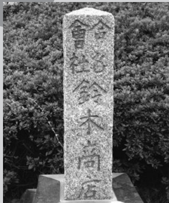
神鋼メタルプロダクツ内にある境界杭