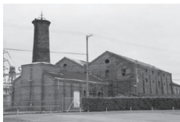
創業期に建設された石炭ボイラー(ダイセル網干工場)