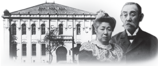
広岡浅子と信五郎

源流の創業期に女性が活躍した双日は、現在においても大手商社の中で唯一、2016年度から6年連続「なでしこ銘柄」に選定されるなど女性活躍の推進に積極的で、ジェンダーに関係なく活躍できる風土づくりに努めている。