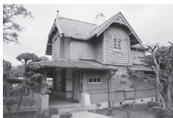
創業期に外国人技師の宿舎として建設された「ダイセル異人館」(ダイセル網干工場)

2011年には、ダイセルが保有する「日本のセルロイド工業の発祥を示す建物および関連資料」、すなわち鈴木商店、岩井商店時代の功績が、化学と化学技術に関する貴重な歴史資料であるとの理由で、公益社団法人日本化学会から化学遺産に認定された。