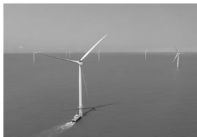
台湾最大級の洋上風力発電事業に参画(2019年)

台湾の天然資源を活用した樟脳事業から始まった双日の台湾ビジネスは、今、台湾の自然エネルギーを活かしたグリーンな事業に挑もうとしている。