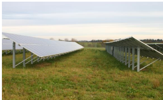
ベッツワイラー ソーラー パーク 【ドイツ】