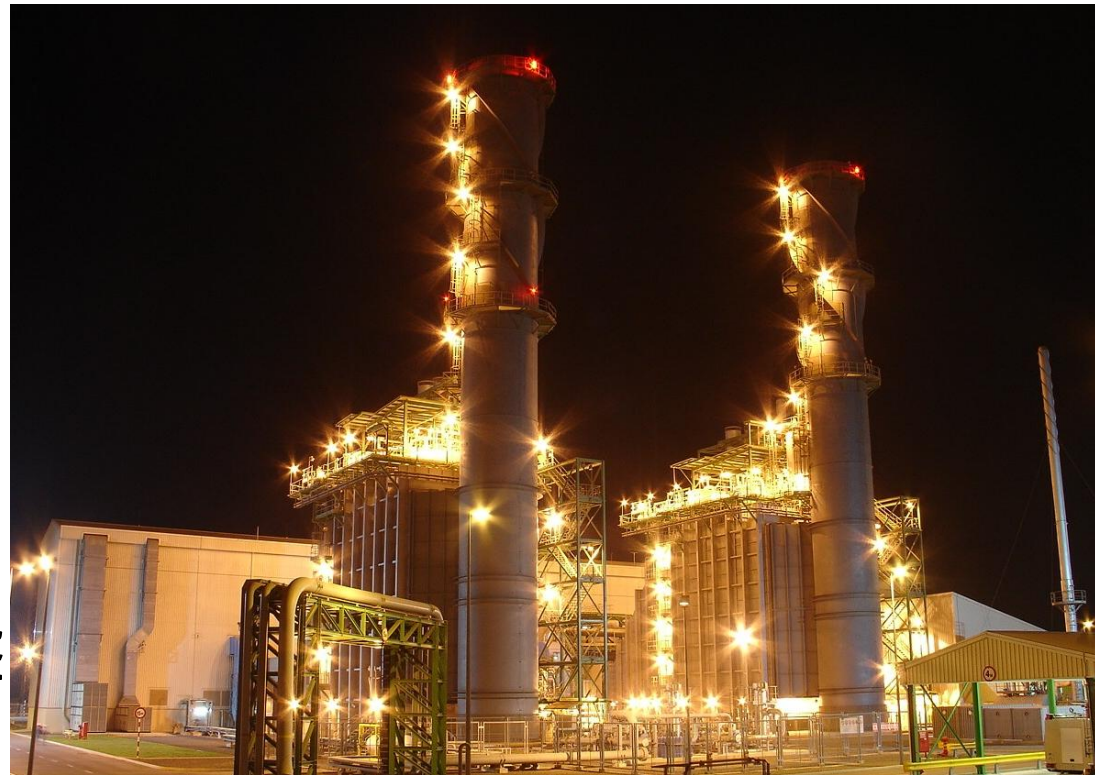
フーミー3(740MW) 【ベトナム】