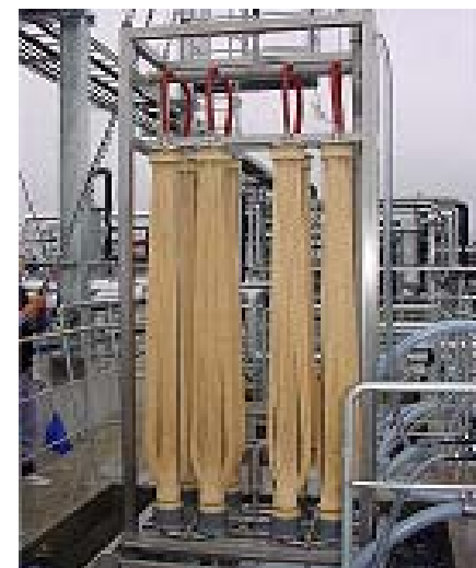
排水処理装置【中国】