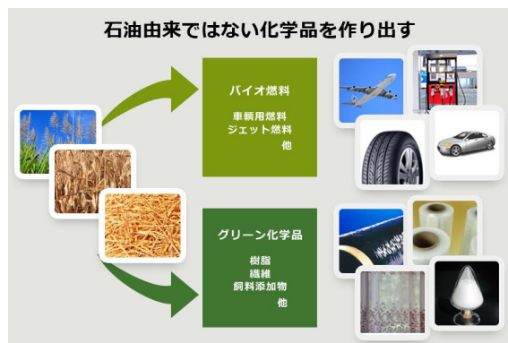
【GEI 社のバイオ化学品製造】

GEI 社のコア技術は、RITE が開発した微生物（コリネ菌）を用いた革新的な発酵生産プロセス（バイオリファイナリー技術）です。従来、処理が難しいとされてきた、非可食バイオマス原料に含まれる特有な糖類の効率的な利用、および発酵阻害物質による影響の排除を実現することで、高効率・低コストでの製品製造が可能となります。また、遺伝子組み換え技術により、目的製品に応じた菌体開発をおこなうことで、多様なバイオ化学品製造への応用が可能です。